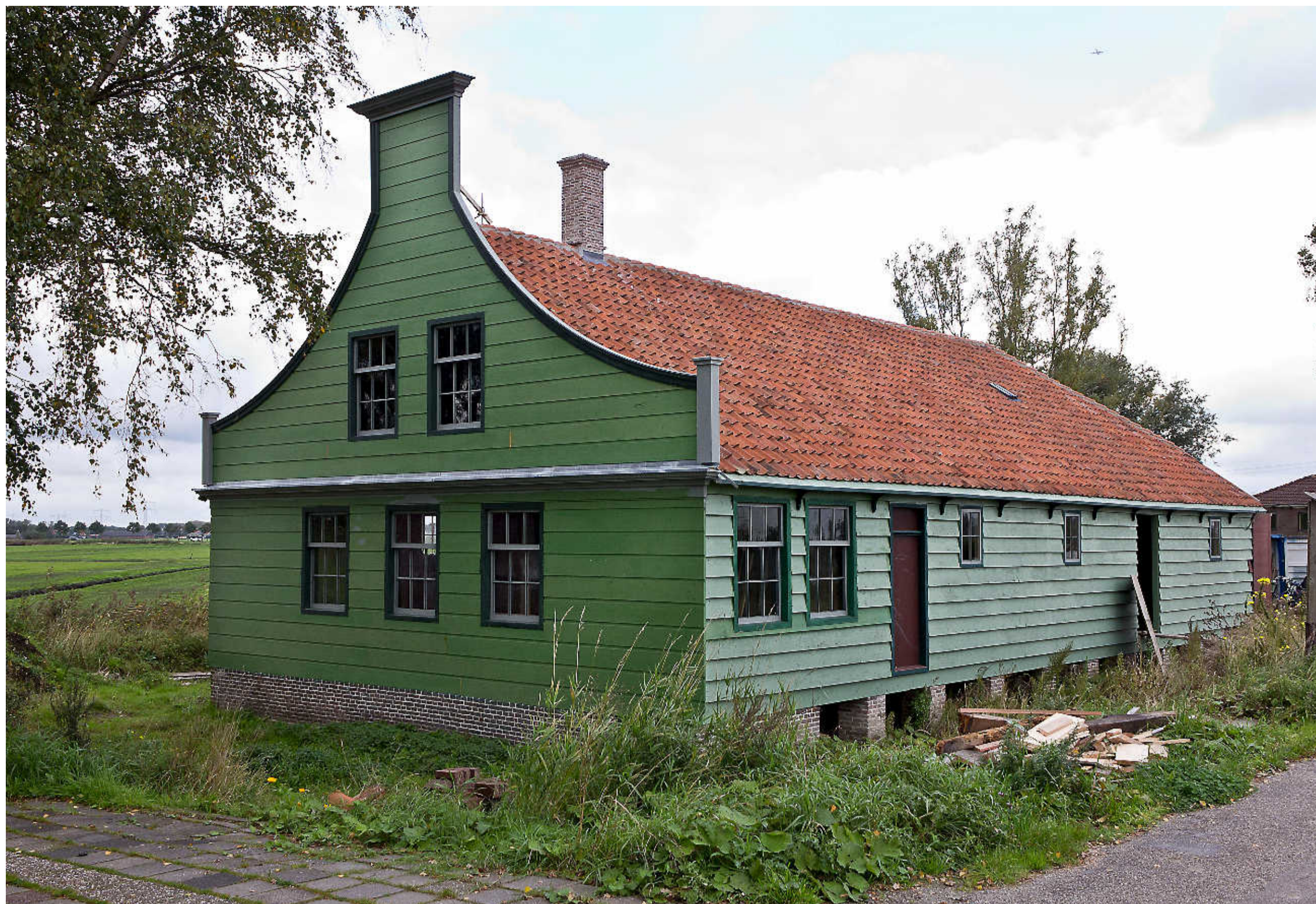
Molenschuur De Paauw is in oude luister hersteld.

De restauratie begon officieel in november 2013, met het opruimen van erf en schuur. Buurtbewoners en ambtenaren hielpen spontaan een handje mee. De laatste bewoner was een 'jager-verzamelaar', zegt Nieuwenhuijs met een lach. „Alles lag vol, tot een meter in de grond. Echt dramatisch. Het mees- te was huisvuil. We zijn maanden bezig geweest. Er is in totaal vierhonderd kuub vuil (het equivalent van 1666 kliko's, red.) weggehaald.” Het herstel van de fundering was eveneens een gedenkwaardigeklus.