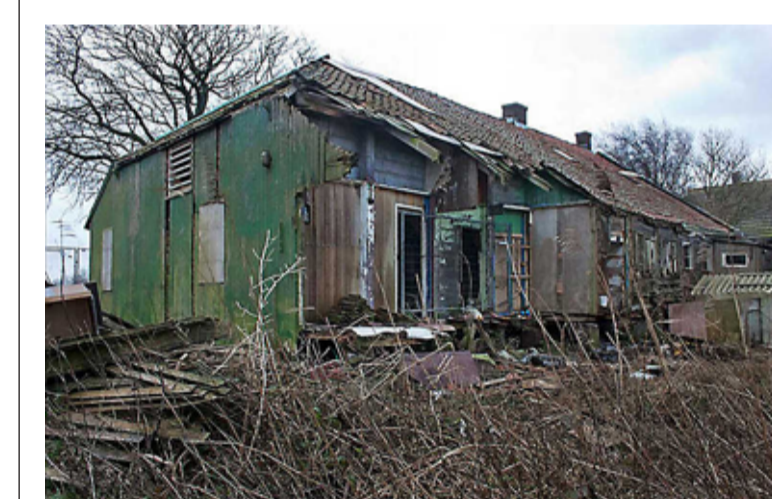
Schuur en erf waren een grote puinhoop.

10x19,6 meter en daar werd met vijf families op gewoond. „Dunne wandjes van twee centimeter ertussen, je hoorde alles. Er hebben hier veel mensen gewoond. Toen we hier aan het werk waren, kwam er elke week wel iemand voorbij die zei: „Oh, hier heb ik nog gewoond. Erg gehorig was het.”