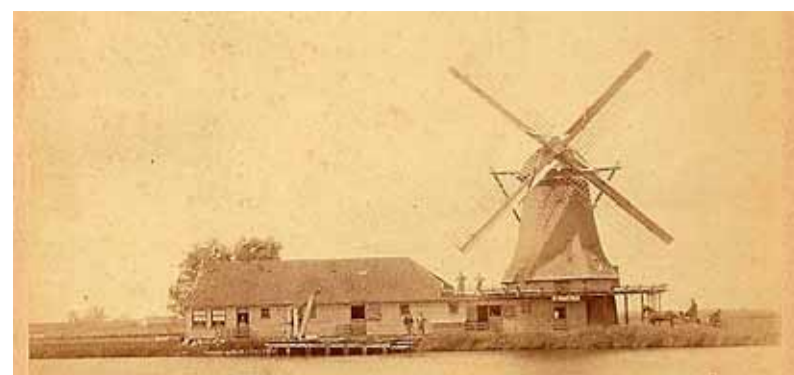
Historische foto van De Paauw met molenschuur.