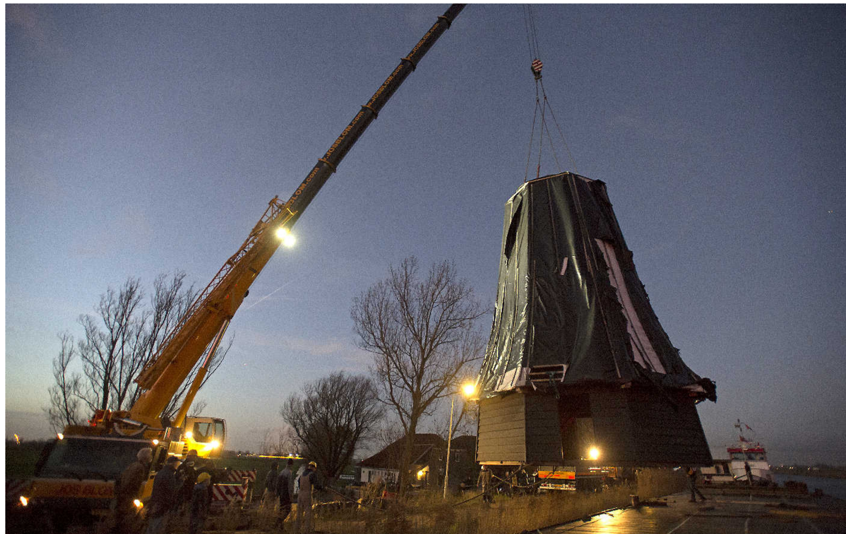
De Haan wordt over de dijk gehesen.

Molenshuur De Paauw in Nauerna heeft weer een molen. Molen De Haan, aangevoerd over water, werd gisteren vanaf de boot op zijn nieuwe plek gehesen.