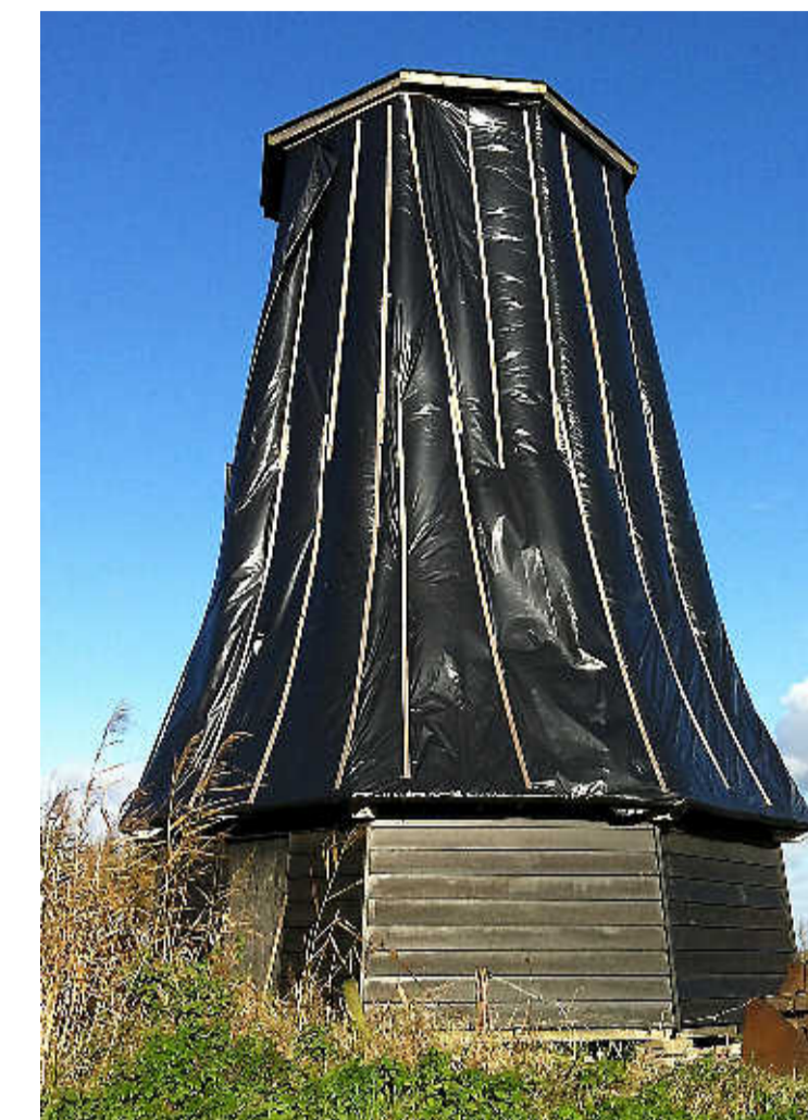
De molenstomp stond jarenlang naast de A7.

sen brug en molen. Uit voorzorg had Nieuwenhuijs een deel van de molen verwijderd. Het lossen van de zeventien ton zware molen nam gisteren langer in beslag dan gedacht. De eerste twee kranen waren niet geschikt voor de slappe en smalle dijk. Pas aan het eind van de dag wist een derde kraan de molen naast de schuur te zetten.