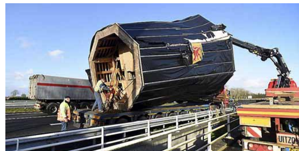
De molen werd afgelopen zaterdag op de A7 op een dieplader geladen.