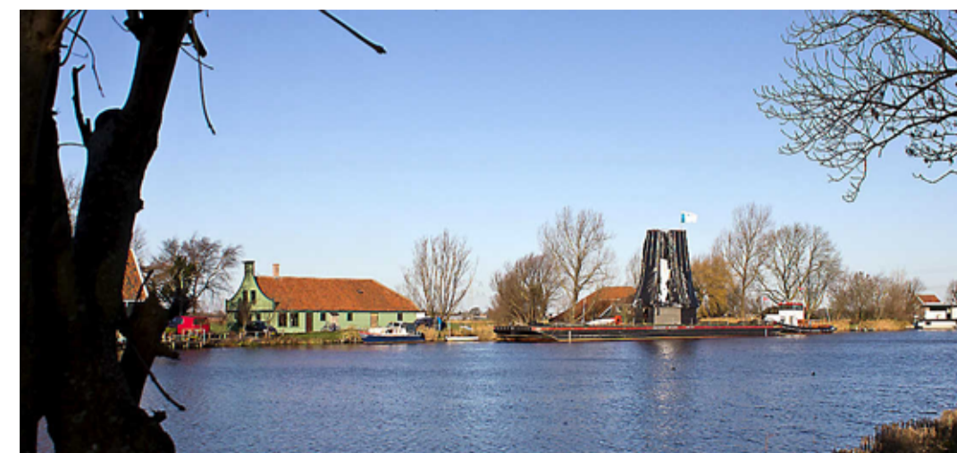
Nauernasche Vaart met De Paauw en de boot met molen.