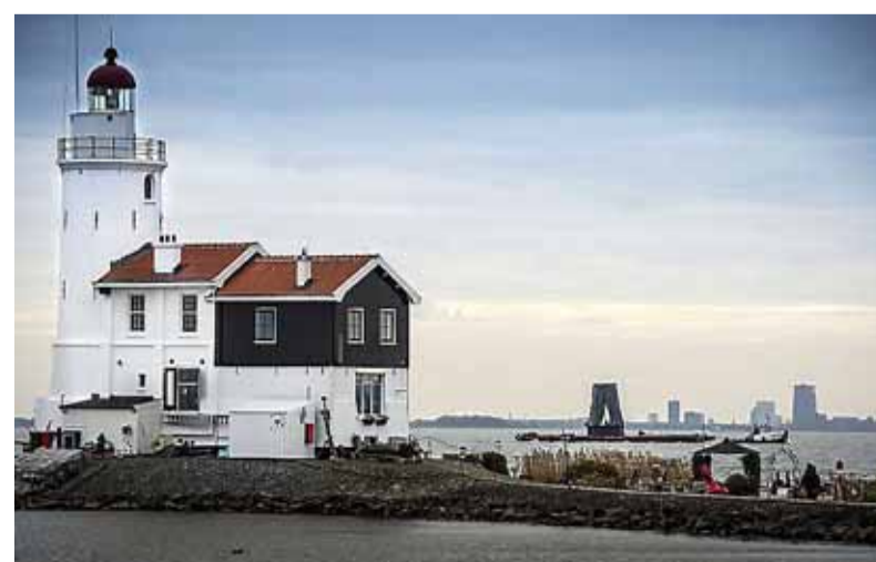
De molenboot voer woensdag langs de vuurtoren van Marken.